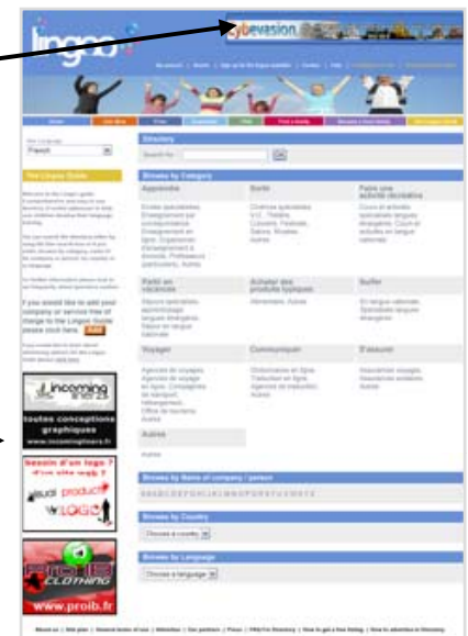
Bouton 180x150 pixels Emplacement privilégié – Guide Lingoo – Ciblage par catégorie